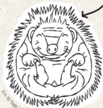
Ein 10 Tage altes Igelbaby.

Von November bis April schlafen die Igel. In Hecken oder Laubhaufen sind sie vor Kälte, Wind und Feuchtigkeit geschützt.